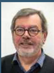
Le Maire de Chabottes

Le maire a la responsabilité de prendre les premières mesures d'urgence pour préserver la sécurité de ses concitoyens. Ces mesures ne relèvent pas d'une gestion improvisée, mais de réflexes d'urgence qui doivent être préparés. Nous le savons tous, le risque zéro n'existe pas. Afin que nous puissions vivre ensemble en toute sécurité, je vous souhaite une bonne lecture, en espérant que vous n'avez jamais à mettre en pratique ce document.